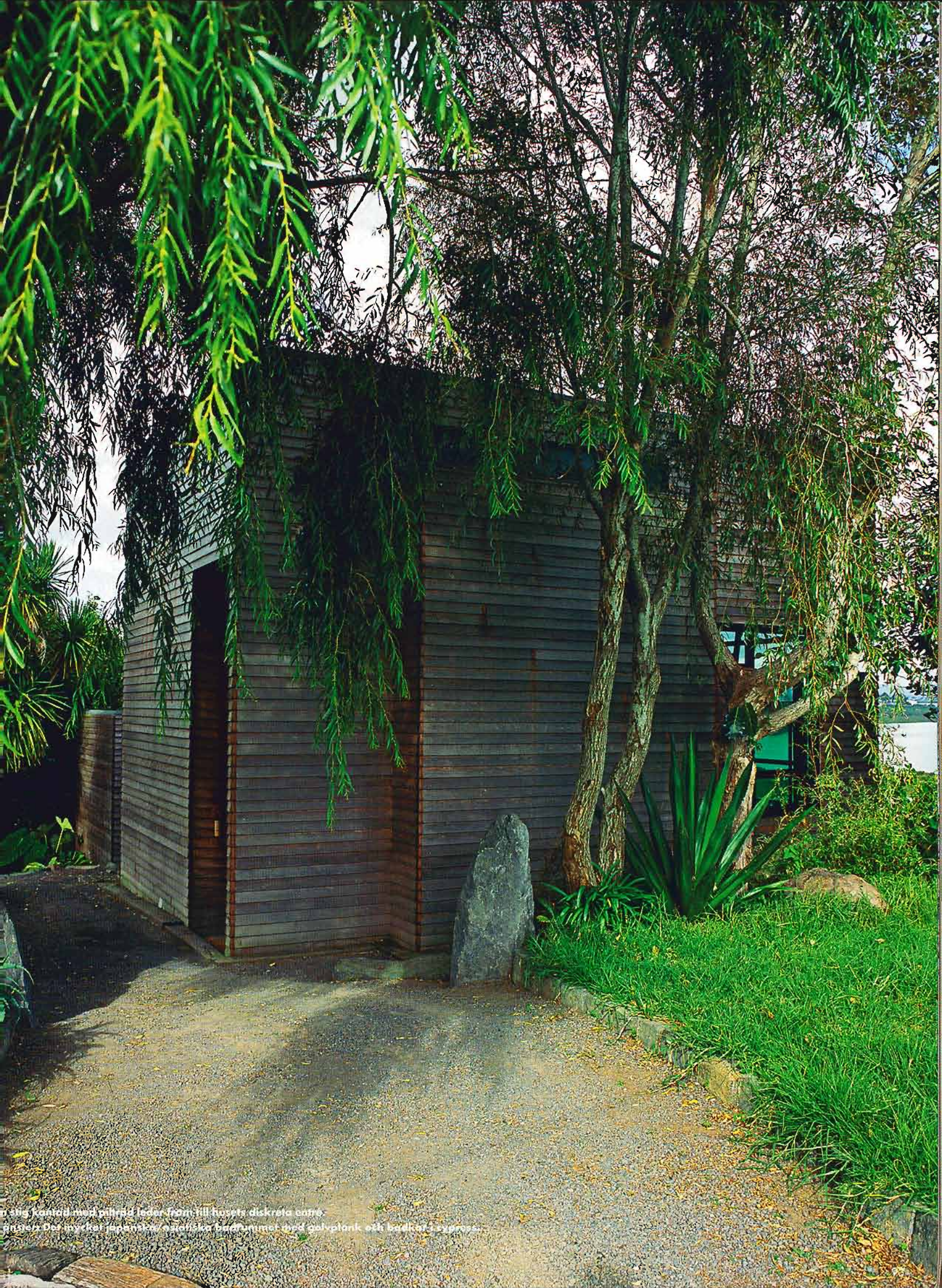
En stig kontrast med mörkt leder fram till husets diskreta entré. Rusten Det inspirerar japanska/asiatiska badrummet med golvplan och badkar i trä.